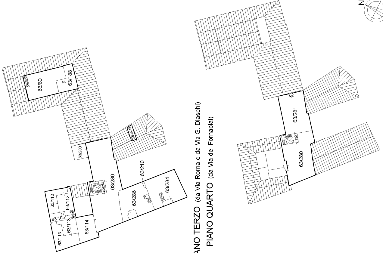
PIANO TERZO (da Via Roma e da Via G. Diaschi) PIANO QUARTO (da Via dei Fornaciai)